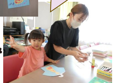
ワニさんに歯みがき中!